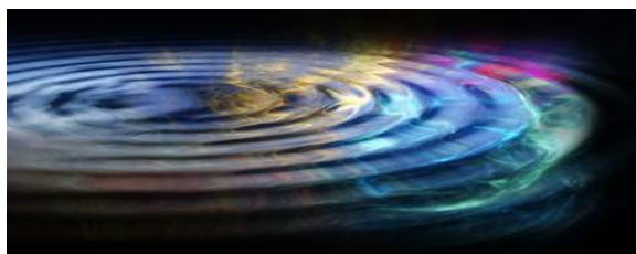
“Dominio di Coerenza in Acqua –Attivata”

d'onda tridimensionale della lunghezza di circa un metro, generando in tal modo la coerenza quantistica dei segnali di informazione ,che vengono irradiati a distanza dal DNA come Biofotoni , i quali pertanto assumono la capacita di guidare con precisione il complesso processo di sintesi che per tramite la conversione ATP/ADP// NADPH/NADP+ ( tra i 260 nm e i 340 nm), trasforma CO2+Acqua in Zuccheri rilasciando ossigeno nell' aria.